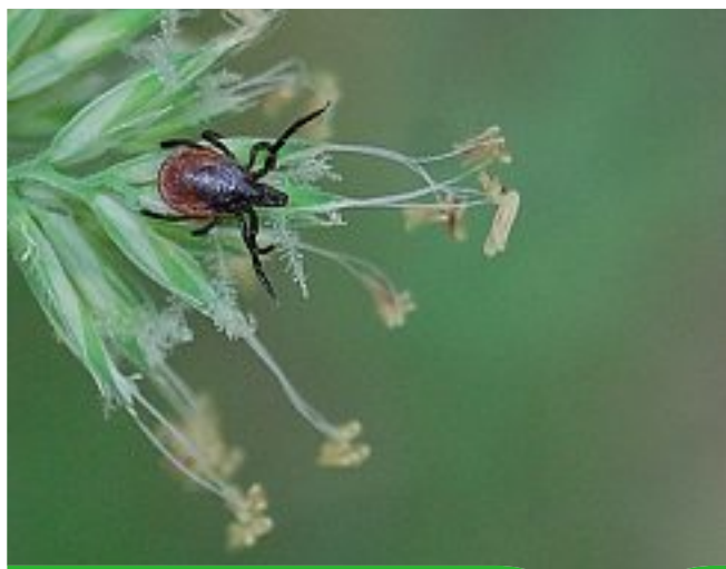
Femelle d' Ixodes ricinus à l'affût sur une tige de dactyle

Les données concernant l'épidémiologie de la BL en France ne sont encore que parcellaires. La difficulté de la surveillance est liée au