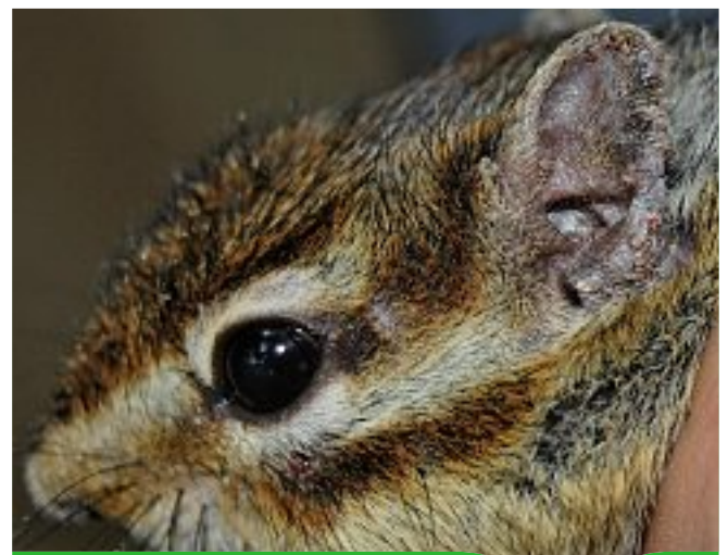
Tiques sur l'oreille d'un tamia de Sibérie