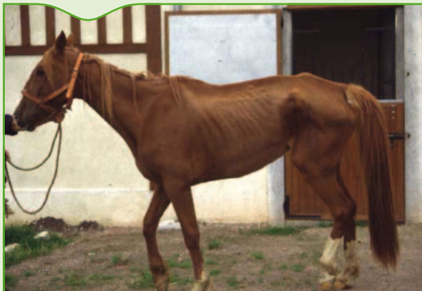
Figure 2. Forme chronique de maladie de l'herbe chez une jument de 10 ans.