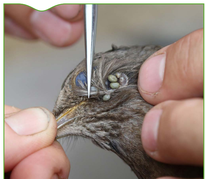
Figure 4. Femelle de merle ( Turdus merula ) infestée par des larves et des nymphes de Hyalomma marginatum

Pour savoir si l'espèce était présente dans d'autres parties du littoral méditerranéen français, zone a priori favorable à son installation (ECDC, 2018), une enquête a été menée en avril-mai 2017, au moment du pic d'activité des adultes, dans tous les départements bordant la Méditerranée, à l'exception des Bouches-du-Rhône pour lesquelles des données préexistaient. Le cheval ayant été identifié en Corse comme l'hôte préférentiel des adultes de H. marginatum (Grech-Angelini et al., 2016), il a été décidé de se concentrer sur cet hôte-sentinel. Les propriétaires de centres hippiques, de chevaux de randonnée,