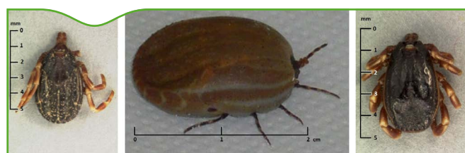
Figure 1. Adultes de Hyalomma marginatum . De gauche à droite: femelle à jeun, femelle gorgée, mâle à jeun